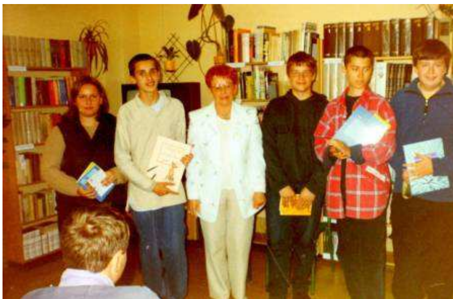
18 czerwca 2002 r. BAL ABSOLWENTÓW.