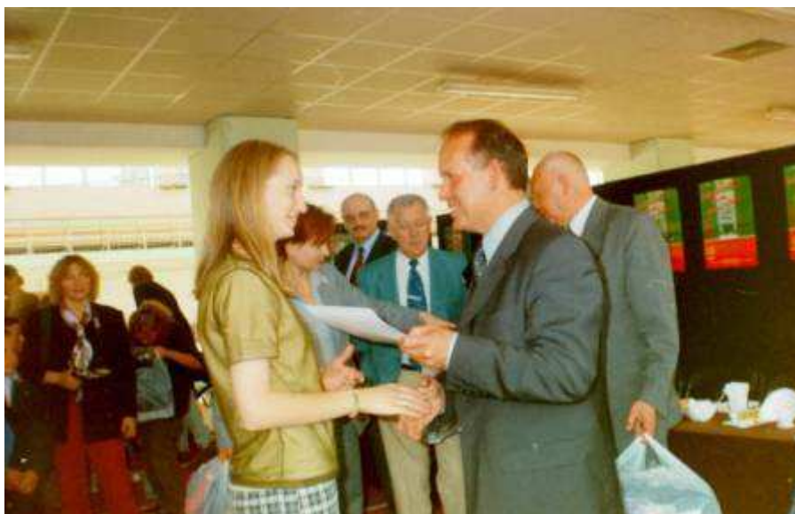
Dzień Sportu – Mistrzostwa Lekkoatletyczne Szkoły